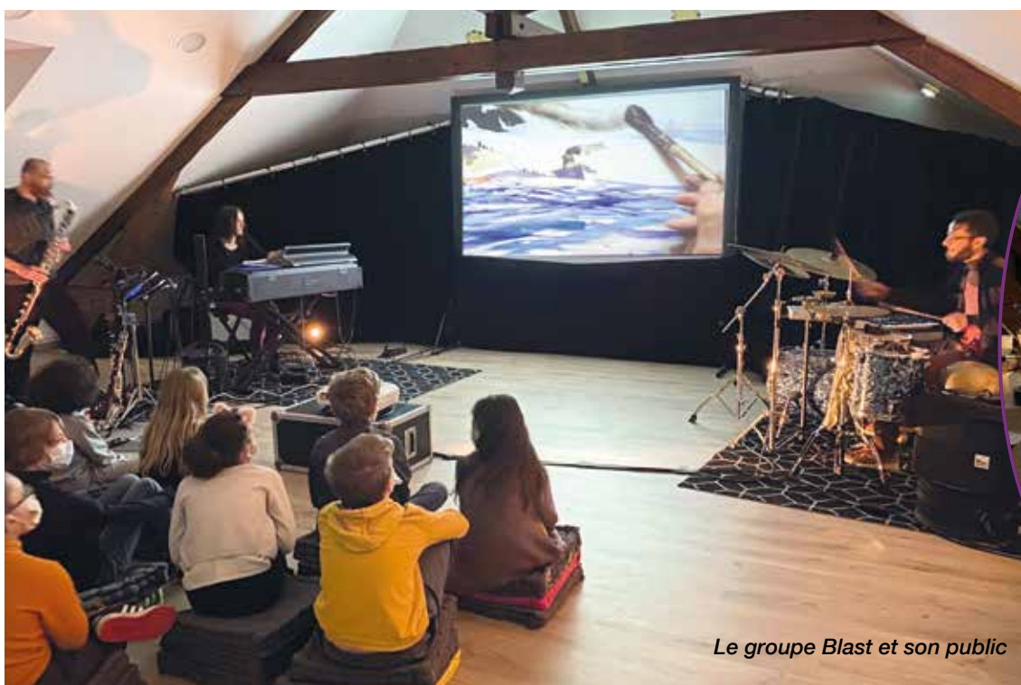
Le groupe Blast et son public

C'est aussi une des dernières sur la place de la République, avant de passer le relais au nouveau monument aux morts, près du groupe scolaire Onimus.