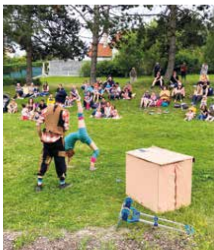
Promenade de la 32, le 11 juillet : les acrobaties de la compagnie Les Yeux Fermés et l'atelier de graffiti sur toile.

Chaque dimanche de juillet, la municipalité a proposé des animations festives, familiales et gratuites.