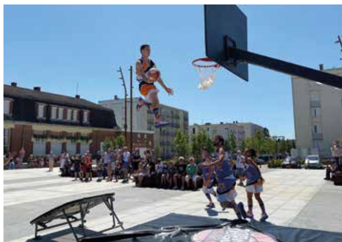
Place de la mairie, le 18 juillet : basket acrobatique.