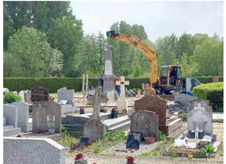
De la place de la République au cimetière communal